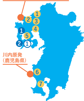
玄海原発 (佐賀県、UPZ内:長崎、福岡県)